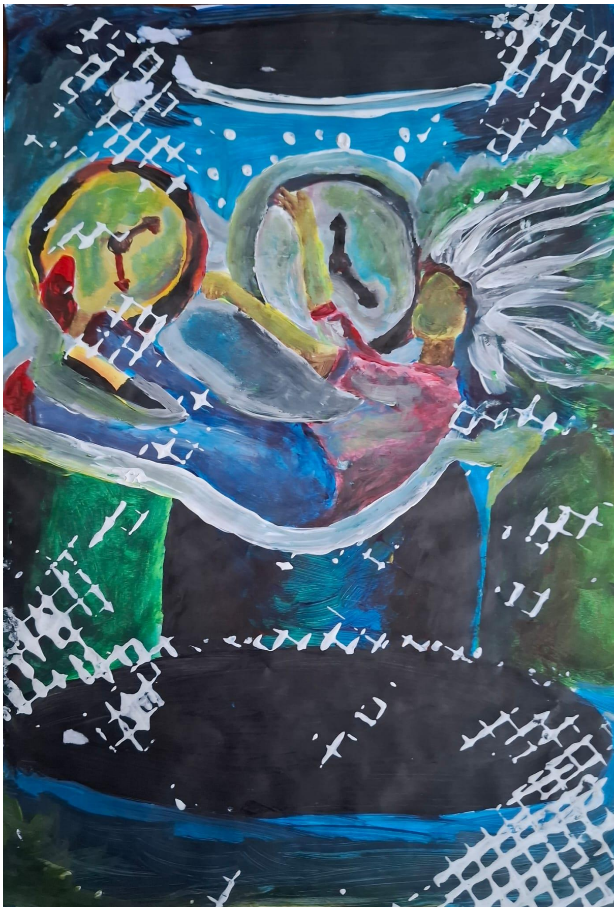
Slika 2, Laura Brozović