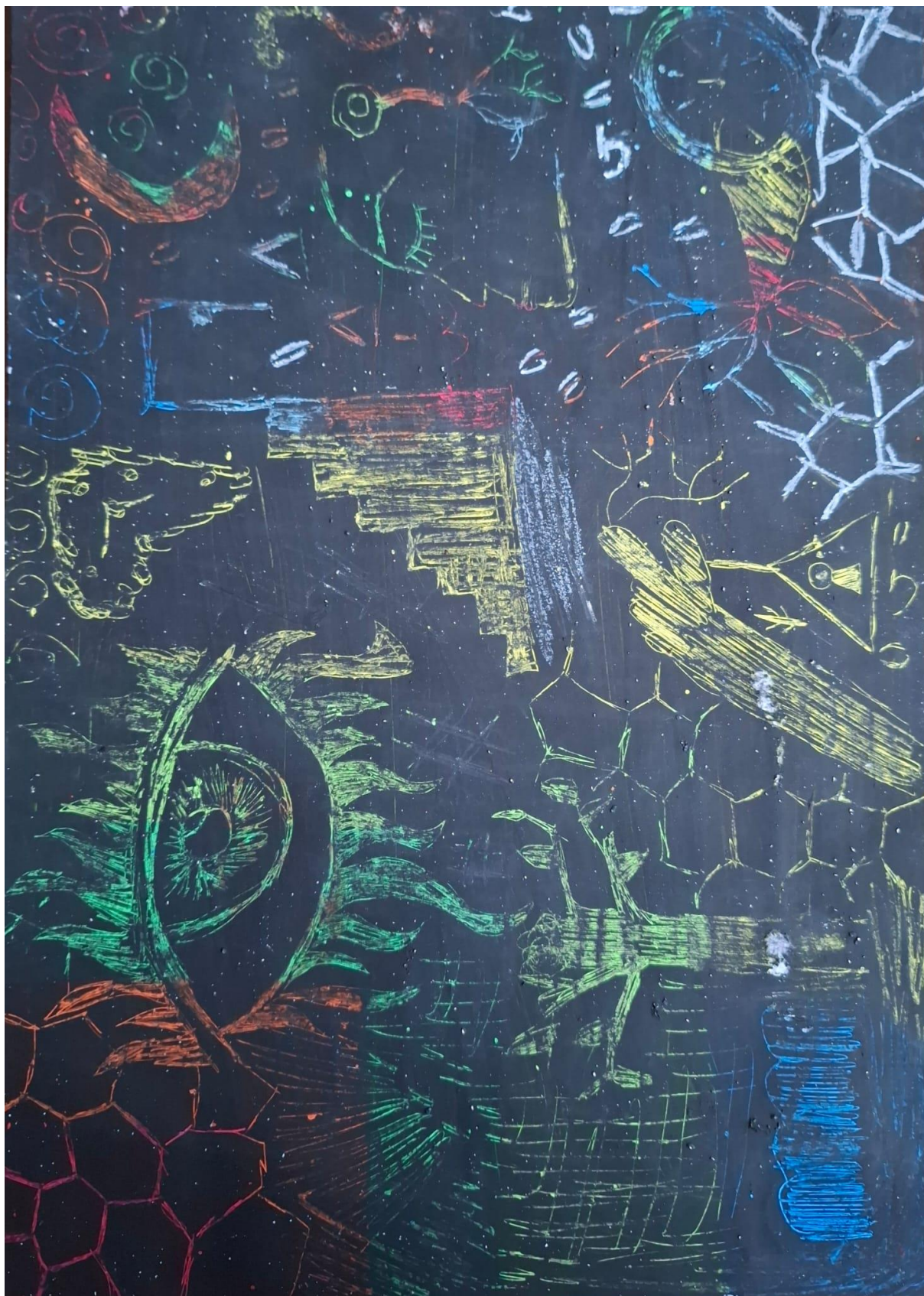
Slika 4, Patricia Musil